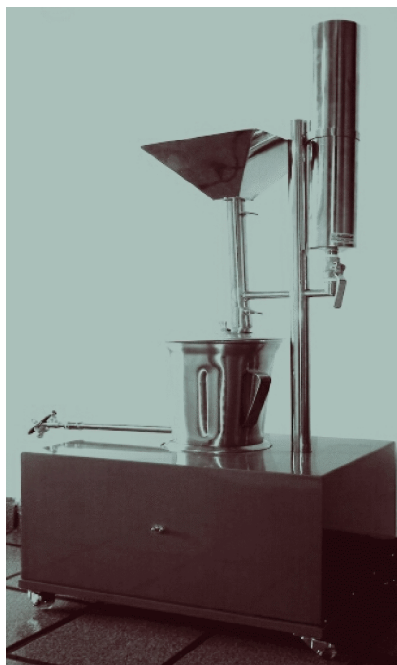
Figura 2. Máquina desenvolvida para produção de extrato de amendoim

Observa-se, na Figura 2, a máquina desenvolvida para a produção de extrato de amendoim, composta por: conjunto de sistema de alimentação, sistema de trituração, sistema de acionamento e base de sustentação. Adotou-se um conceito compacto, funcional, de fácil operação, limpeza das peças, regulagem e manutenção por uma ou duas pessoas. Foi projetada para demandar um pequeno esforço físico por parte de quem o opera, produz num sistema contínuo de abastecimento, 8 L de extrato em uma só etapa após a qual o resíduo deve ser removido para se dar início a uma nova etapa e, assim, sucessivamente.